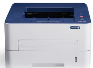
Phaser 3260. Impresión.