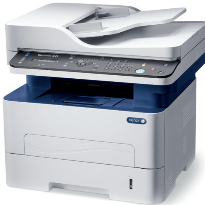
WorkCentre 3225. Copia. Impresión. Escaneado. Fax. Correo electrónico.